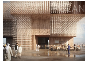
Fot: projekt polskiego pawilonu na EXPO 2020

EXPO 2020 w Dubaju odbędzie się między 20 października 2020 r. a 10 kwietnia 2021 r.